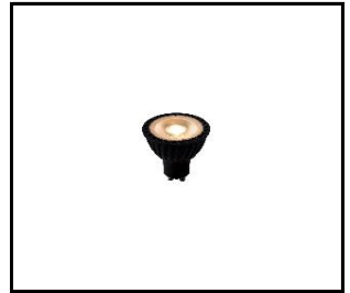
LUCIDE LIGHT SOURCE